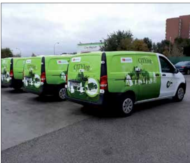
20 furgonetas Mercedes Vito transformadas a gas natural comprimido (GNC), con la homologación ECO de la DGT para acceder al centro urbano de Madrid, al ser vehículos EURO 6.